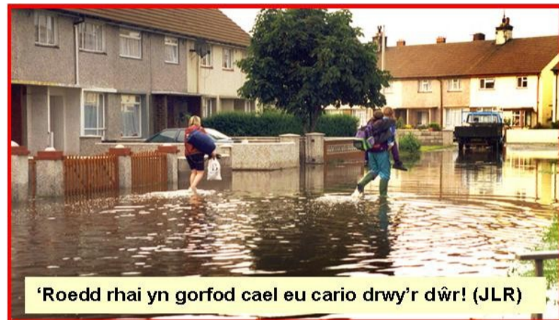
'Roedd rhai yn gorfod cael eu cario drwy'r dŵr! (JLR)

'R oedd y dŷr yn llifo fel rhaeadr nerthol yn ardal Llanrhos, a daliwyd nifer yn gaeth yn eu ceir am oriau lawer. (JLR)