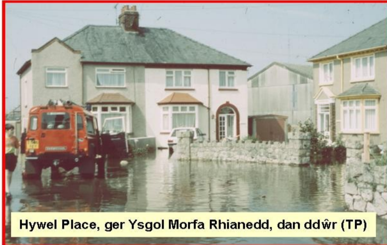
Hywel Place, ger Ysgol Morfa Rhianedd, dan ddŵr (TP)