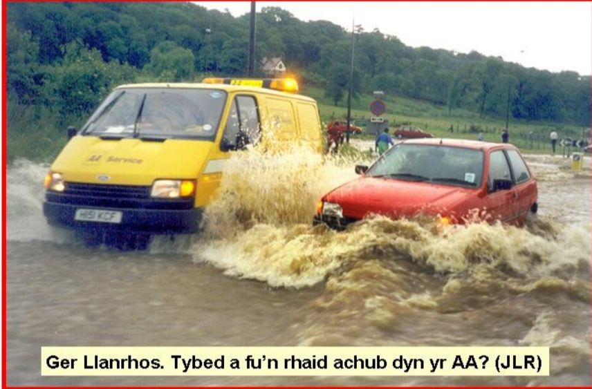
Ger Llanrhos. Tybed a fu'n rhaid achub dyn yr AA?