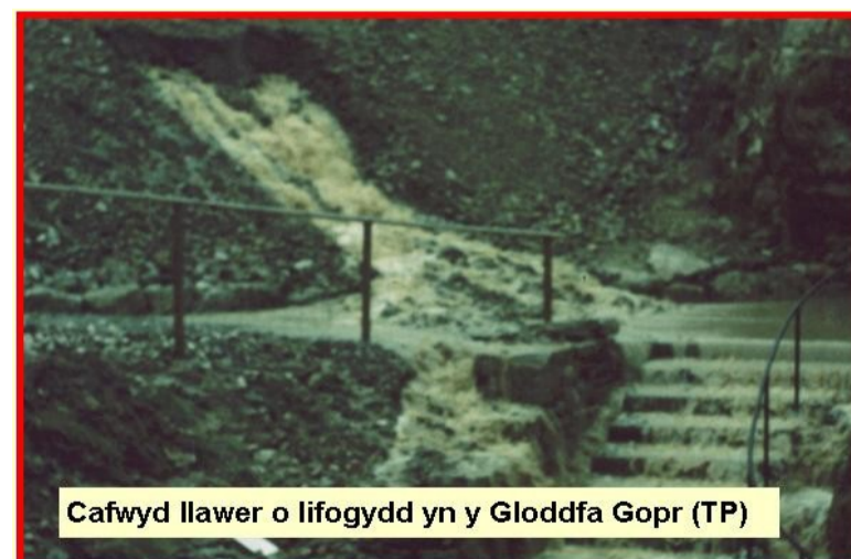
Cafwyd llawer o lifogydd yn y Gloddfa Gopr (TP)