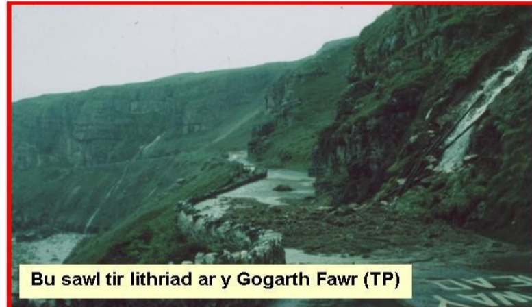
Bu sawl tir lithriad ar y Gogarth Fawr (TP)