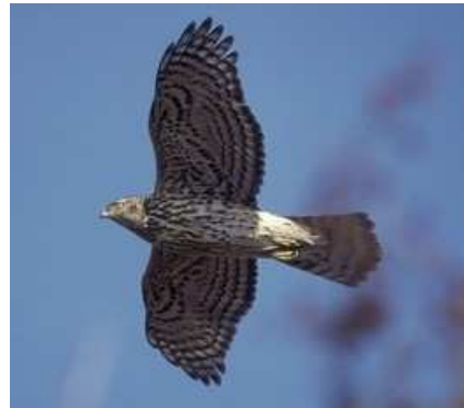
Adenydd Gwalch Marth