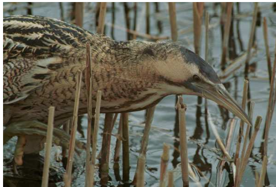
Aderyn y bwn

Mae awgrym y cyfreithiau bod lladd yr aderyn hwn yn ddigwyddiad prin yn gyson â'r cefndir adaryddol. Er y gellir credu bod yr aderyn hwn yn eithaf cyffredin yn yr Oesoedd Canol diweddar am nad oedd llawer o'r gwlyptir, lle roedd yn byw, wedi'u draenio erbyn hynny, mae'r aderyn yn treulio'r rhan fwyaf o'i amser yn llechu o dan gyrs uchel a chuddliw effeithiol iawn amdano.