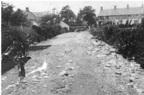
Y Lôn Ddwr yng ngwaelod pentref Llanllyfni.

Ysgubodd y cenlli'r ffordd o'i blaen, nes cyrraedd giat Cae-du Isaf, lle diflannodd y ffordd yn llwyr, a gadael afon, o glawdd i glawdd.