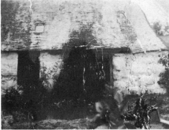
Ty Mwd, Talgarnedd a'r dwr yn lifo drwyddo